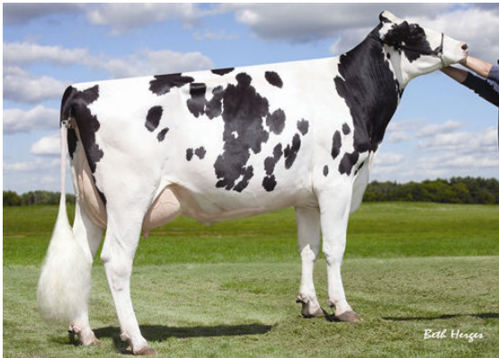
SULLY SHOTTLE MAY-TW FOURTH DAM